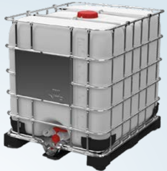
IBC Plus 1000 Palet de plástico