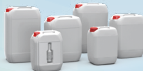
Jerricanes polietileno PEHD