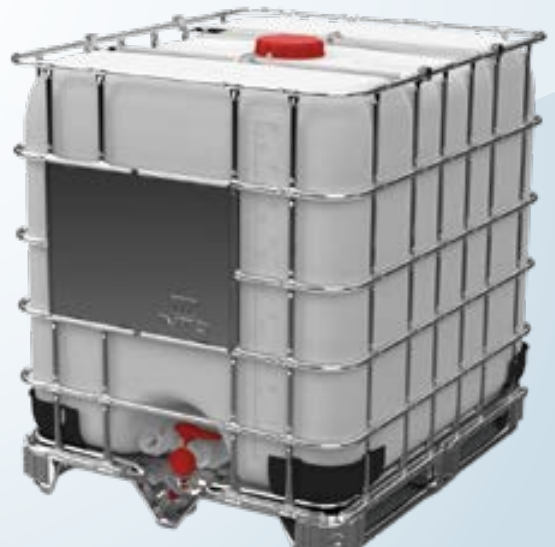
IBC Plus 1000 Palet de acero "Smart Lift"