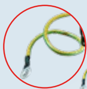
Válvula con cable toma tierra