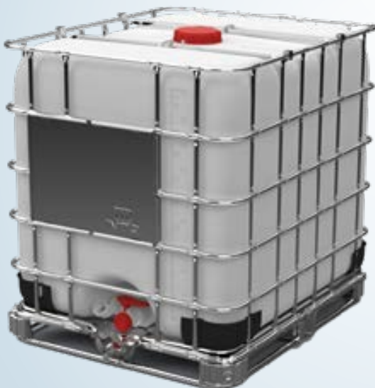
IBC Plus 1000 Palet de acero