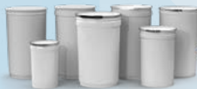
Bidones de acero cónicos