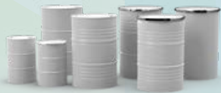
Bidones de acero cilíndricos