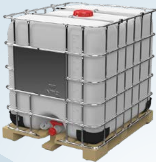
IBC Plus 1000 Palet de madera