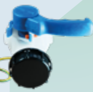
Válvula de mariposa o bola en 2" (DN 50) y 3" (DN 80)