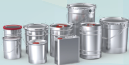
Envases de hojalata