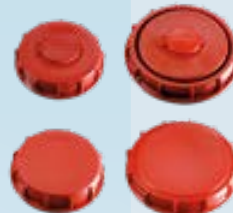
Tapa DN 150 y DN 225 con opción venteo